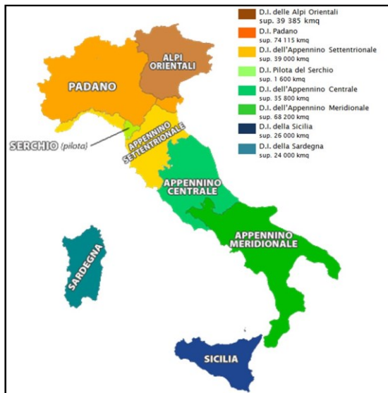
Figura 2 - Distretti Idrografici in Italia