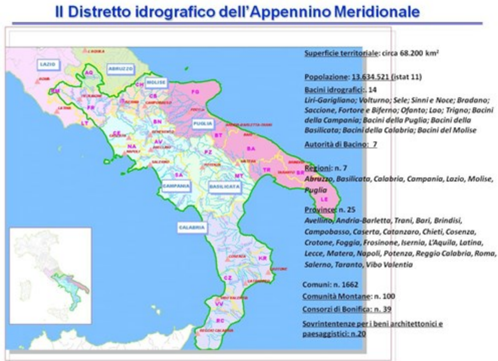
Figura 3 - Distretti Idrografico dell'Appennino Meridionale

Il Distretto Idrografico dell'Appennino Meridionale – come definito dall'art. 64 del D. Lgs. n. 152/2006 (di recepimento della Direttiva 2000/60/CE e ripreso dalla L. 221/15) e come detto sopra include i territori delle Regioni Abruzzo e Lazio (in parte), Basilicata, Calabria, Campania, Molise e Puglia (totalmente), comprendendo 25 Province, 1664 Comuni, 100 Comunità Montane, 44 Consorzi di Bonifica, 978 Aree Naturali Protette, con una popolazione residente pari a 13.634.521 abitanti (dati Istat al 2011) che rappresenta circa il 22,9% della popolazione nazionale.